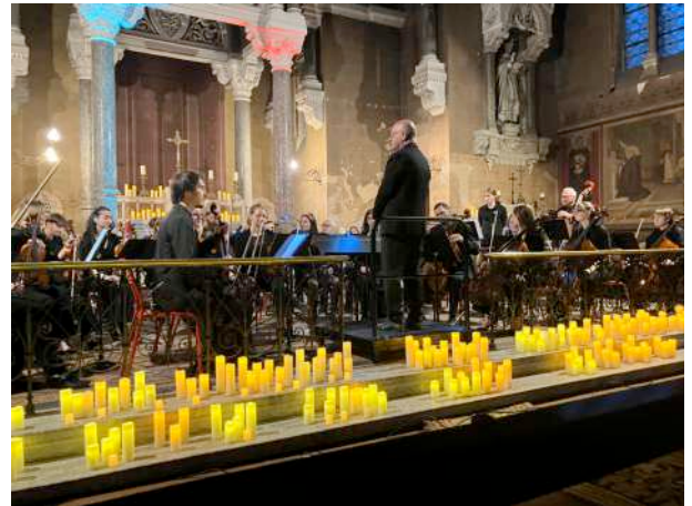
Un moment de grâce dans la Chapelle éclairée à la bougie