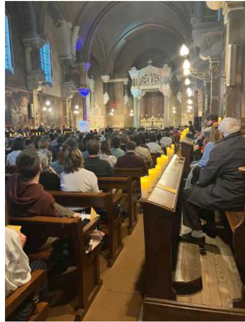
Les deux travées et les bas-côtés de gauche à droite