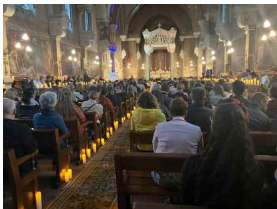
Un public nombreux