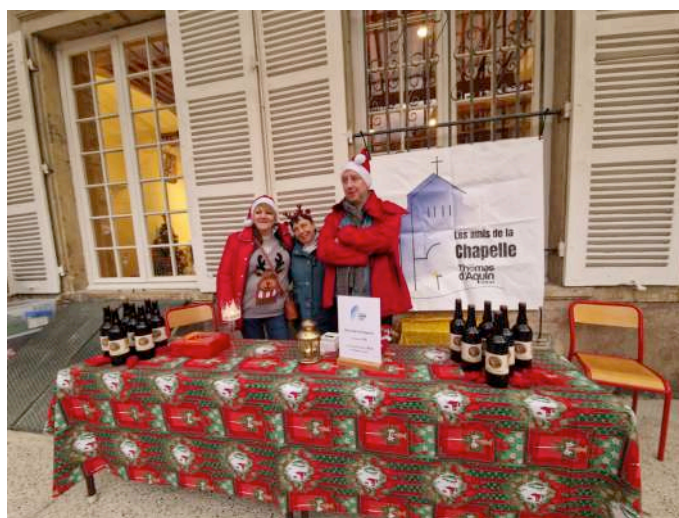
Notre stand avec les bières de la Chapelle

Vernissage de l'exposition de photos de la Chapelle et du site d'Oullins faites par Thibault LAZERT-SAURY, ancien élève et membre du CA, le 21 janvier 2025 : l'exposition a attiré 70 à 80 personnes. L'accompagnement musical par deux violonistes a été apprécié et a créé une chaude ambiance. L'exposition de photos a bien décoré la salle Lacordaire et est restée accessible dans cette salle jusqu'au 21 juin 2025.